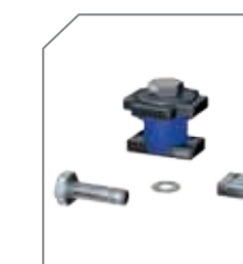
Réduction du nombre de pièces requises