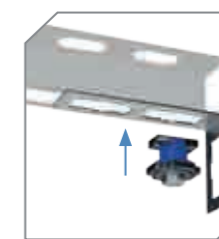
Installation en hauteur avec une seule main